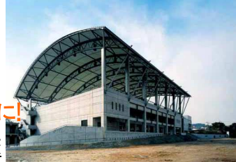
↑愛知県半田市立成南中学校に併設のスポーツクラブが運営する体育館「クラブハウス」

市の案がダメなら、どんな案がいいのか? そこで、市全体の『横須賀みらい計画』をつくって みました。そのうち北下浦の分をご紹介します。