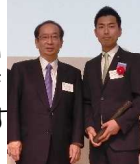
TVでおなじみの北川元知事と→

このたび、全国で優れた取り組みをしている政治家を表彰する「 マニフェスト大賞 」で、 受賞しました! 3年連続の受賞は横須賀で初。全国でも珍しいようです。最初の受賞が「ハコモノ研」の活動でした。その後、回を重ね今回で6回目を迎えます