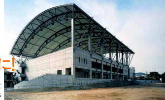
↑愛知県半田市立成岩中学校に併設のスポーツクラブが運営する体育館「クラブハウズ」

市の案がダメなら、どんな案がいいのか? そこで、市全体の『横須賀未来計画』をつくってみました。そのうち浦賀・大津・久里浜の分をご紹介します。